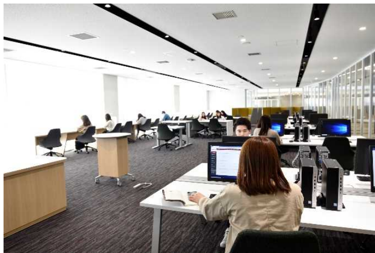
(ナレッジクラウド)

新宿キャンパスは電子書籍、電子ジャーナル、データベースを利用した電子資料を提供している。他キャンパス同様、学内 LAN 経由で CiNii (NII 学術情報ナビゲータ) などの学術情報にアクセスすることができる。利用者は町田キャンパス、四谷キャンパス図書室所蔵資料を取寄せることもできる。また国立情報学研究所が提供する目録所在情報サービス (NACSIS-CAT/ILL) を通じて、利用者が求める資料を迅速に提供している。